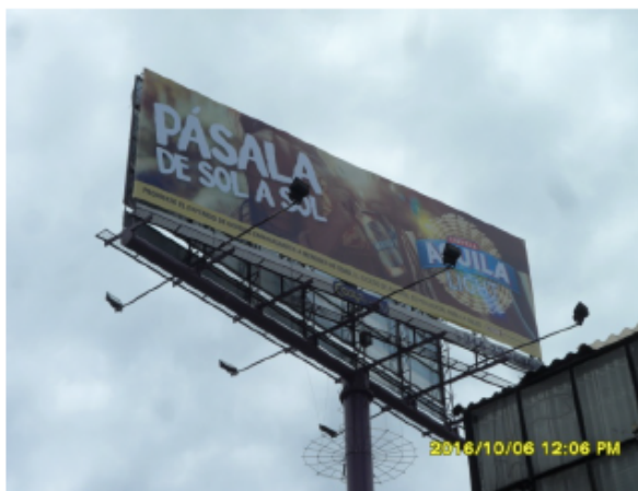
SENTIDO ESTE-OESTE DE LA VALLA COMERCIAL TUBULAR