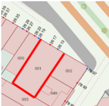
NOMENCLATURAS CATASTRALES PRINCIPAL: AVENIDA CALLE 80 No 26-17 SECUNDARIA: AVENIDA CALLE 80 No 26-13