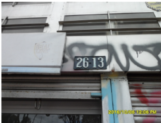
NOMENCLATURA DEL PREDIO